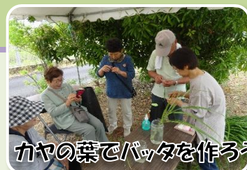
カヤの葉でバッタを作ろう

参加者は講師の先生の説明を聞きながら、集中してカヤの葉を編んでいました。本物そっくりのバッタができましたね！