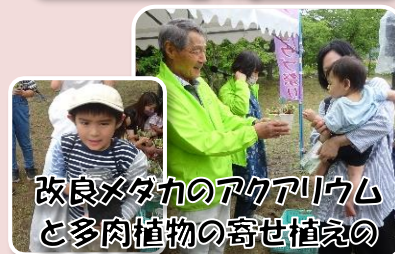
改良メダカのアクアリウム と多肉植物の寄せ植えの