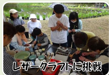
レザークラフトに挑戦