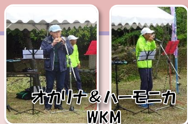
オカリナ&ハーモニカ WKM

※天候不順のため、中止した「神楽とバンド演奏」を楽しみにされていた皆様には大変申し訳ありませんでした。